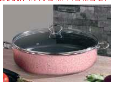
GRANİT MAXI BASIK TENCERE /