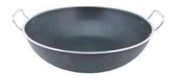
PIRLANTA KAVURMA TENCERESI